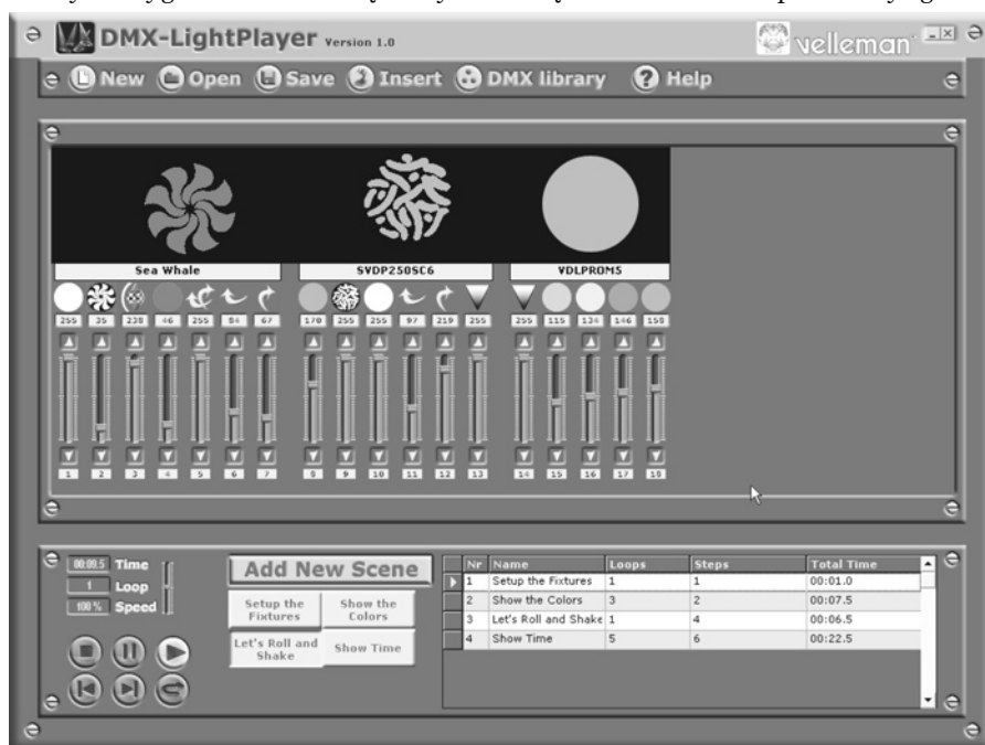
Rys. 5. Okno programu Light Player

SK1, SK2: złącze baterii 9 V SK3: Złącze MX3 SK4: Złącze USB-B do druku SW1: włącznik X1: kwarc 6 MHz FS1, FS2: bezpiecznik PTC 3 A/60 VDC Złącze XLR Uchwyt baterii 9 V Obudowa